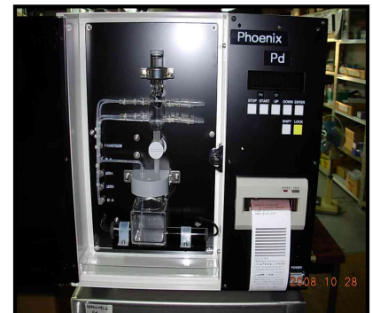
装置本体イメージ