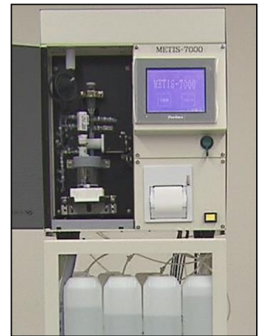
装置本体イメージ