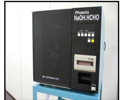
装置本体イメージ