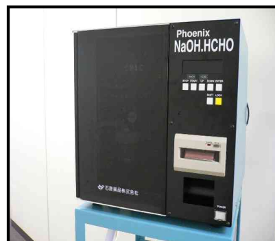
装置本体イメージ