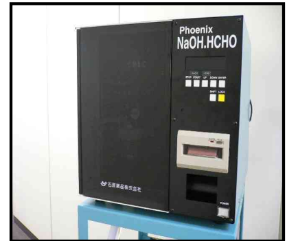
装置本体イメージ