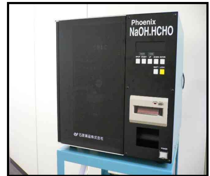
装置本体イメージ