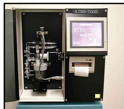
装置本体イメージ