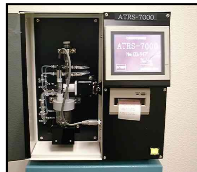
装置本体イメージ