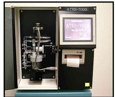
装置本体イメージ写真 (写真はNa 2 CO 3 )