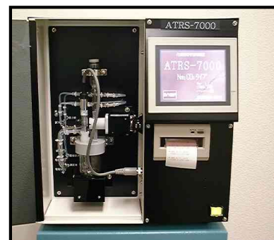
装置本体イメージ