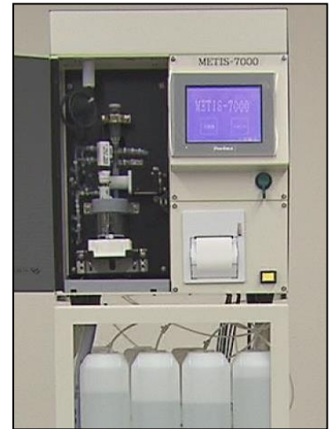
装置本体イメージ