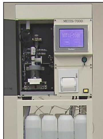
装置本体イメージ